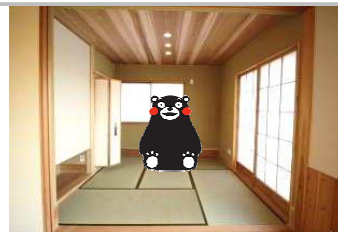
上: 和室の畳は熊本産の減農薬畳。 赤ちゃんが寝転がっても安心!