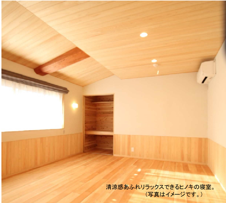
清涼感あふれリラックスできるヒノキの寝室。 (写真はイメージです。)

「無垢材が好き！」と仰る方が増えてきました。自然の木の温もりや手触りの良さは何物にも代えがたい魅力です。それと無垢材の大きな特徴が「香り」です。一口に「木の香り」といっても、樹種によって全く違うのをご存知でしょうか？