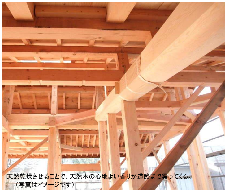
天然乾燥させることで、天然木の心地よい香りが道路まで漂ってくる。 (写真はイメージです)

結婚や出産を機に家を新築する方も多いと思いますが、特に出産を機に家を新築するときは、家で使われる「建材」に気をつける必要があります。生まれたばかりで抵抗力の少ない赤ちゃんも、出産後のお母さんも、新築の家の「空気」で一日中呼吸し続けるからです。