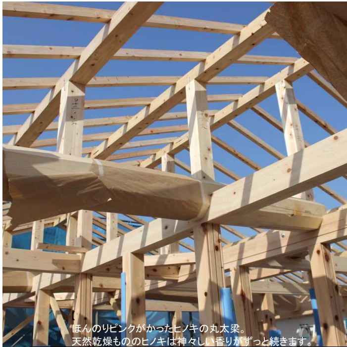
ほんのりピンクがかったヒノキの丸太梁。 天然乾燥もののヒノキは神々しい香りがずっと続きます。

一昔前なら市販の芳香剤で家のイヤなニオイや車のニオイをごまかしていたものですが、今はアロマディフューザーやアロマポットに天然のエッセンシャルオイル（精油）を入れて香りを楽しむ方法も、ずいぶんと普及してきました。