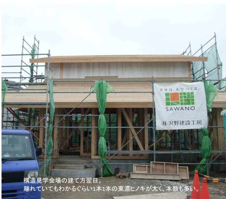
構造見学会場の建て方翌日。 離れていてもわかるくらい1本1本の東濃ヒノキが太く、本数も多い。

私たちがつくる家は、天然木の香り豊かな家が大なる特徴です。一口に天然木といっても、木の種類によって香りも効能も様々です。たとえば、ヒノキは建立から1300年以上経っている法隆寺に使われているほどの耐久性を誇ります。現代でも伊勢神宮の宇治橋は総檜造り。神々しいヒノキの香りは離れたところまで漂い、雨ざらしになっても次の式年遷宮まで使えるほど湿気に強いのです。