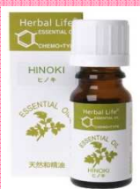
参考画像:「生活の木」