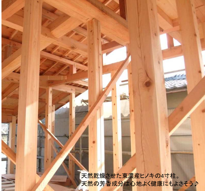
天然乾燥させた東濃産ヒノキの4寸柱。 天然の芳香成分は心地よく健康にもよさそう♪

最近「〇〇の香り」と銘打った香りの強い柔軟剤がよく売れているそうです。しかし「柔軟剤の(人工的な)香りで頭が痛くなった・・・」という声も増えてきました。人為的に作った香り成分(合成香料)は、シックハウスと似たような症状を起こすこともあるので注意して使いたいところです。もっとも同じ香りといっても、アロマテラピーのように 天然精油の芳香成分でお肌や体調を整えたりリラックスできる香り もあります。