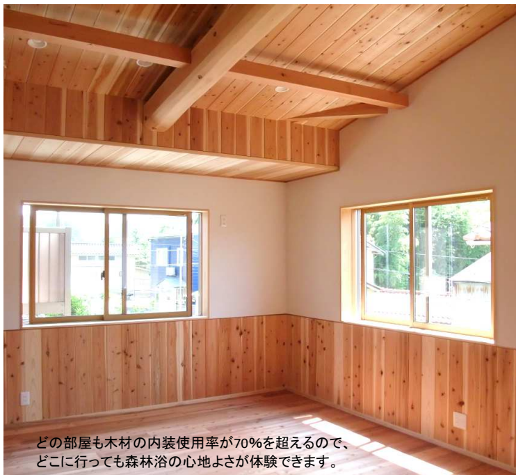
どの部屋も木材の内装使用率が70%を超えるので、どこに行っても森林浴の心地よさが体験できます。

建て替える前の家は、増改築を繰り返したことで使い勝手も悪く、とても寒い家だったそうです。そんなご家族にこそ、長く安心して健康に住まいしてほしいと願った私たちは、下記の材料を一切使わないことにしました。例えば・・・