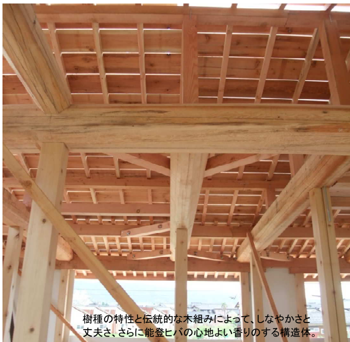
樹種の特性と伝統的な木組みによって、しなやかさと丈夫さ、さらに能登ヒバの心地よい香りのする構造体。

みなさんは日常的にどのような香りの中で生活していますか？最近では洗剤や芳香剤だけでなく、様々な製品に人工的な芳香成分がつけられ「〇〇の香り」と販売されていますが、「人工的な香りで気分が悪くなった・・・」という声も聞くようになりました。