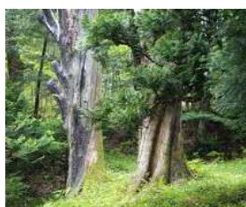
【上の写真】元祖アテ 石川県最古級のアテ(能登ヒバ)で、石川県指定の天然記念物。樹齢は、約450年以上、樹高は約30m、幹周は4.0m