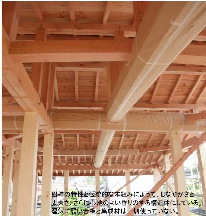
樹種の特徴と伝統的な木組みによって、しなやかさと丈夫さ、さらに心地よい香りのする構造体になっている。湿気に弱い合板と集成材は一切使っていない。

今年4月に発生した熊本地震では、あらためて自然災害の力を思い知らされました。熊本地震で被害に遭われた方々には、一日も早い復興と心の傷みが和らぐようお祈り申し上げます。